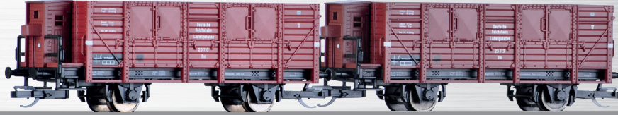
Art.-Nr.: 502104 Güterwagenset der DRG, Ep. II